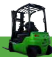
CESAB B400 48V-4-ruote