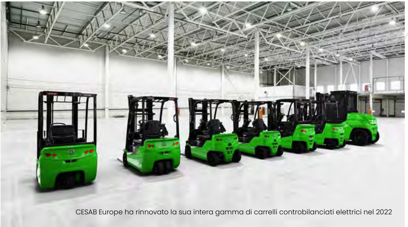
CESAB Europe ha rinnovato la sua intera gamma di carrelli controbilanciati elettrici nel 2022

Le immagini possono mostrare attrezzature o accessori opzionali non inclusi nella versione standard del carrello